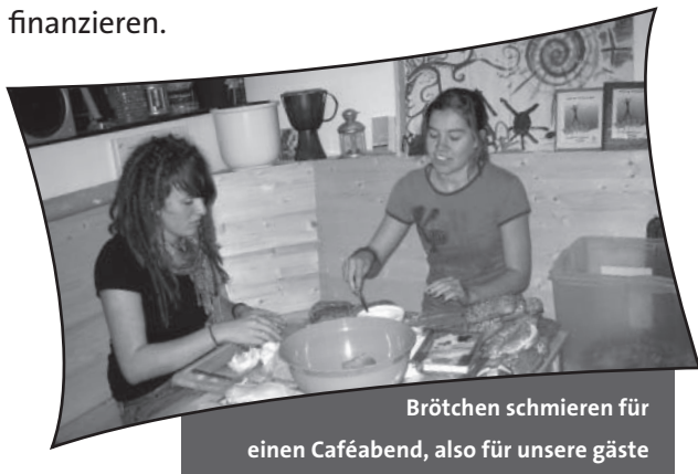
Brötchen schmieren für einen Caféabend, also für unsere Gäste

Am liebsten mochte ich die Arbeit in einem Kontaktcafé in der Kurfürstenstraße, dem Prostituiertenstrich Berlins. Dort war ich jeden Freitagabend. Es ist wie eine Oase für die Frauen, die meistens drogenabhängig sind und mit dem Anschaffen ihre Sucht finanzieren.