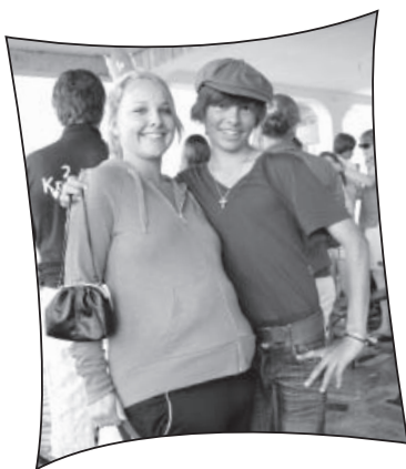
Viel Trubel am Bunten Abend und mittendrin natürlich Bruce Darnell und Cindy aus Marzahn.

Die Wiese neben unserem Haus lud zum Volleyball- oder Fußballspielen ein oder sie wurde für andere lustige Spiele genutzt. Dies hier sind keine morgendlichen Turnübungen, sondern ein Kennenlernspiel, bei dem es darum geht, zusammen mit seinem Partner eine bestimmte Haltung einzunehmen.